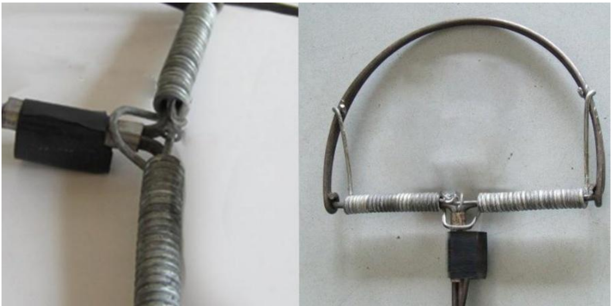
Cố định 2 lò xo lại với nhau

Bước 2: Tiếp theo, khi đã tạo hình cho 2 đoạn dây thép xong các bạn sử dụng tiếp đến 2 lò xo. Hãy cố định chúng lại với nhau giữa khớp nối 2 vòng bán nguyệt như hình để tạo ra sức bật rất lớn hơn giúp bạn nhanh chóng tóm gọn chuột khi chúng vừa chạm vào bẫy.