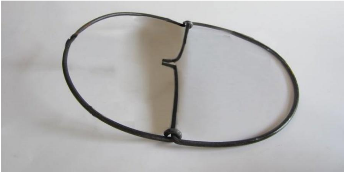
Uốn công 2 dây kẽm thành hình bán nguyệt[/caption]

Bước 2: Tiếp theo, khi đã tạo hình cho 2 đoạn dây thép xong các bạn sử dụng tiếp đến 2 lò xo. Hãy cố định chúng lại với nhau giữa khớp nối 2 vòng bán nguyệt như hình để tạo ra sức bật rất lớn hơn giúp bạn nhanh chóng tóm gọn chuột khi chúng vừa chạm vào bẫy.