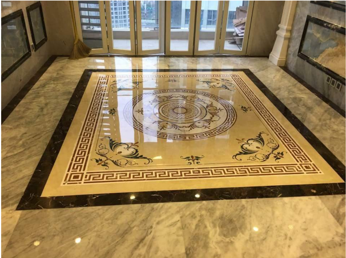
Gạch thảm kết hợp với đá tự nhiên