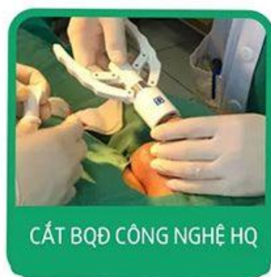
CẮT BQĐ CÔNG NGHỆ HQ