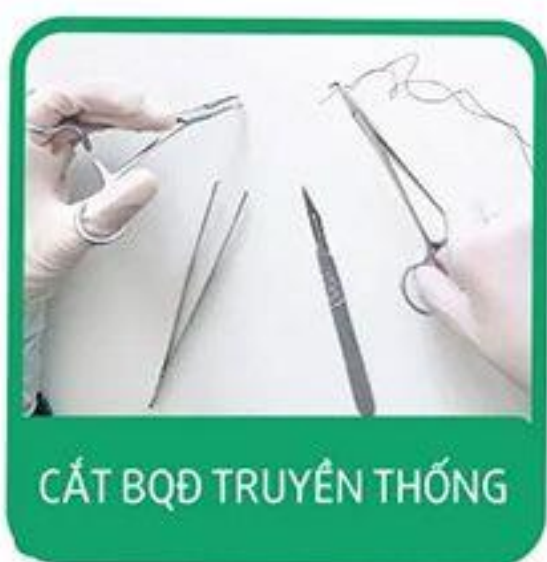
CẮT BQĐ TRUYỀN THỐNG