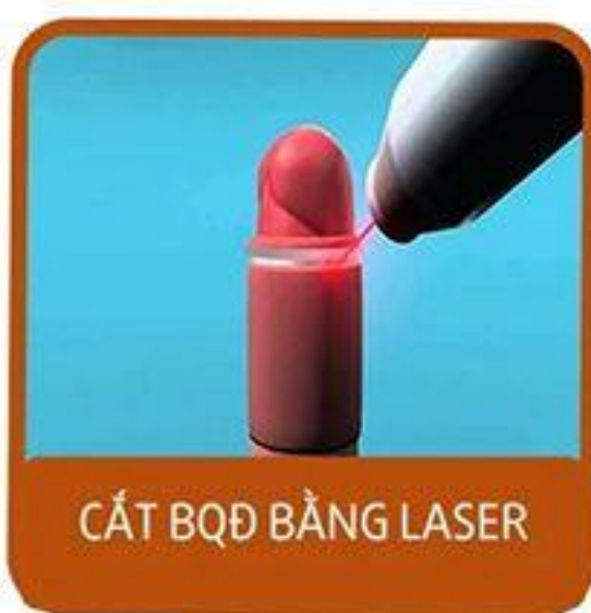
CẮT BQĐ BẰNG LASER