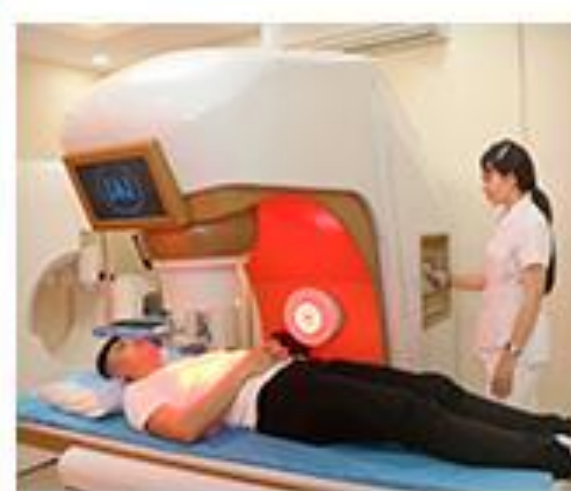
PHÒNG VẬT LÝ TRỊ LIỆU

Phòng khám Đa khoa Quốc tế Cần Thơ luôn chú trọng đầu tư các dòng máy hiện đại bậc nhất thế giới