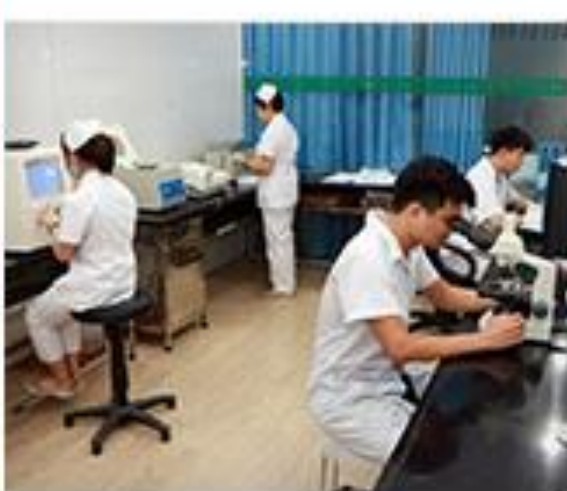
PHÒNG XÉT NGHIỆM