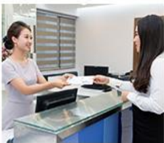
QUẦY LỄ TÂN