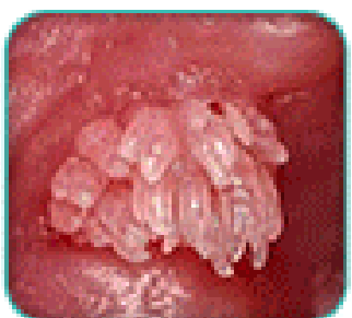
Giai đoạn 2