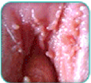
Giai đoạn 1